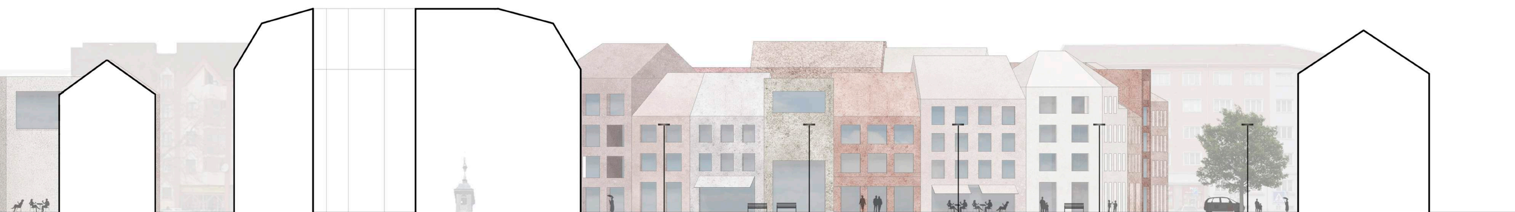
g) řezopohled A-A' 1:250