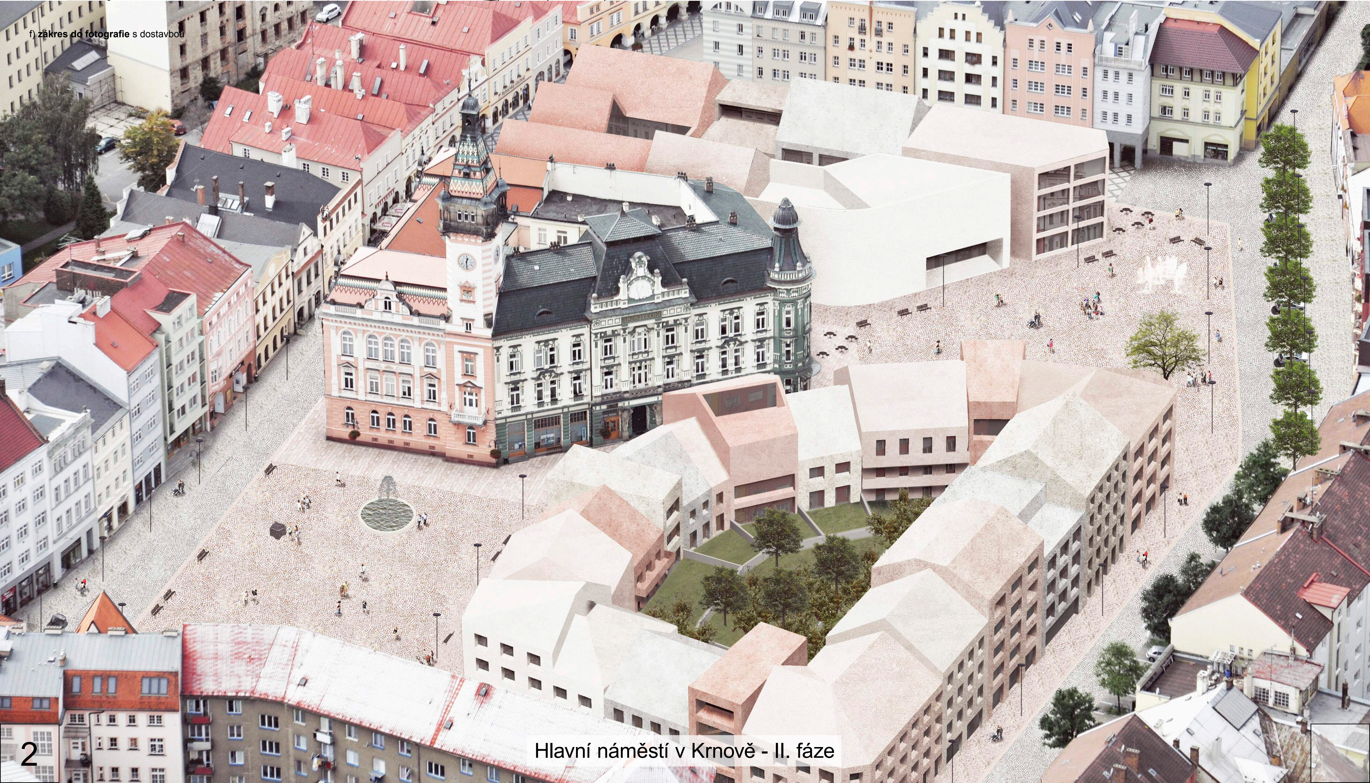
f) záznam od fotografie s dostavbou