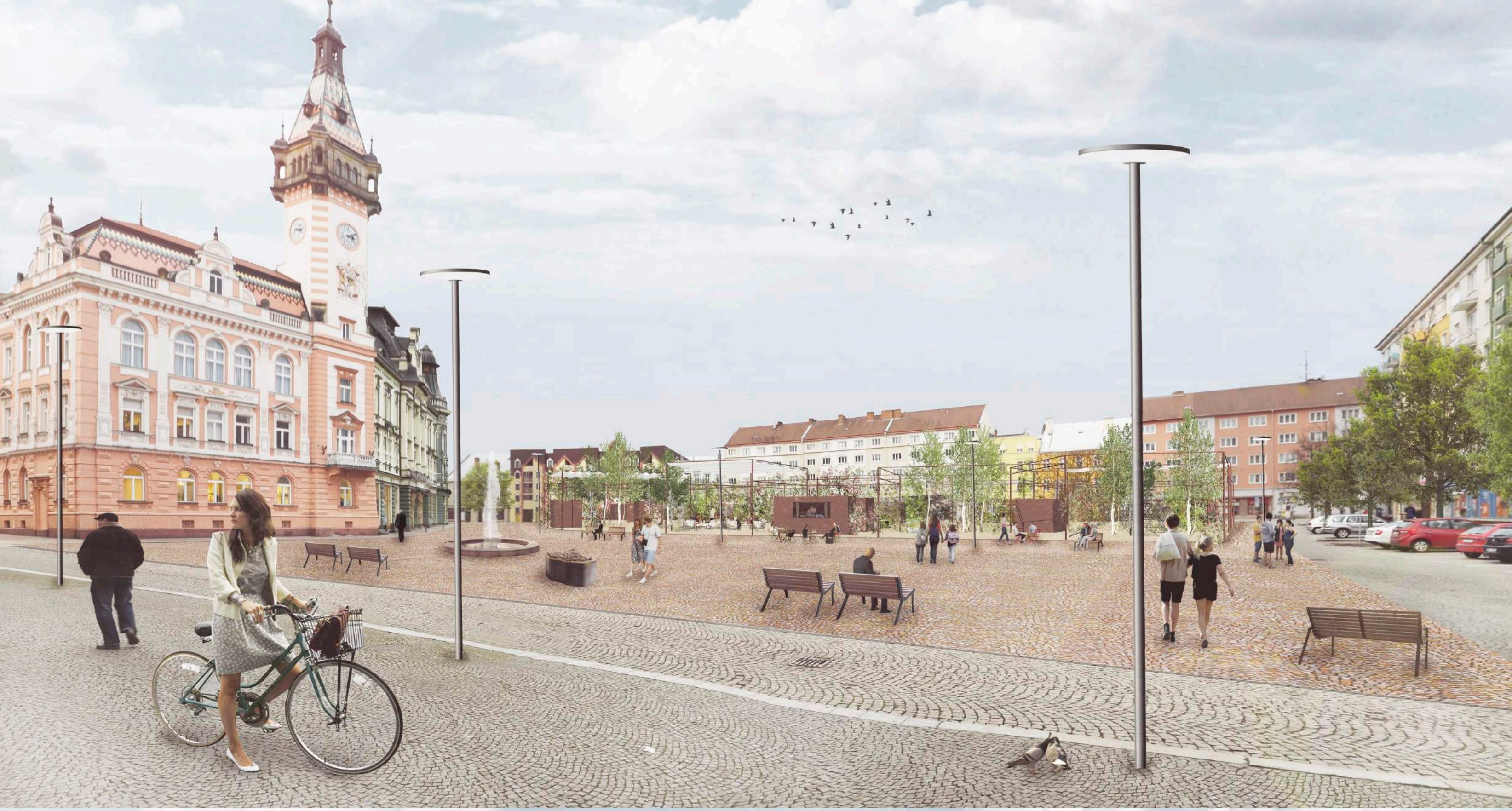
k) zázres do fotografie bez dostavby