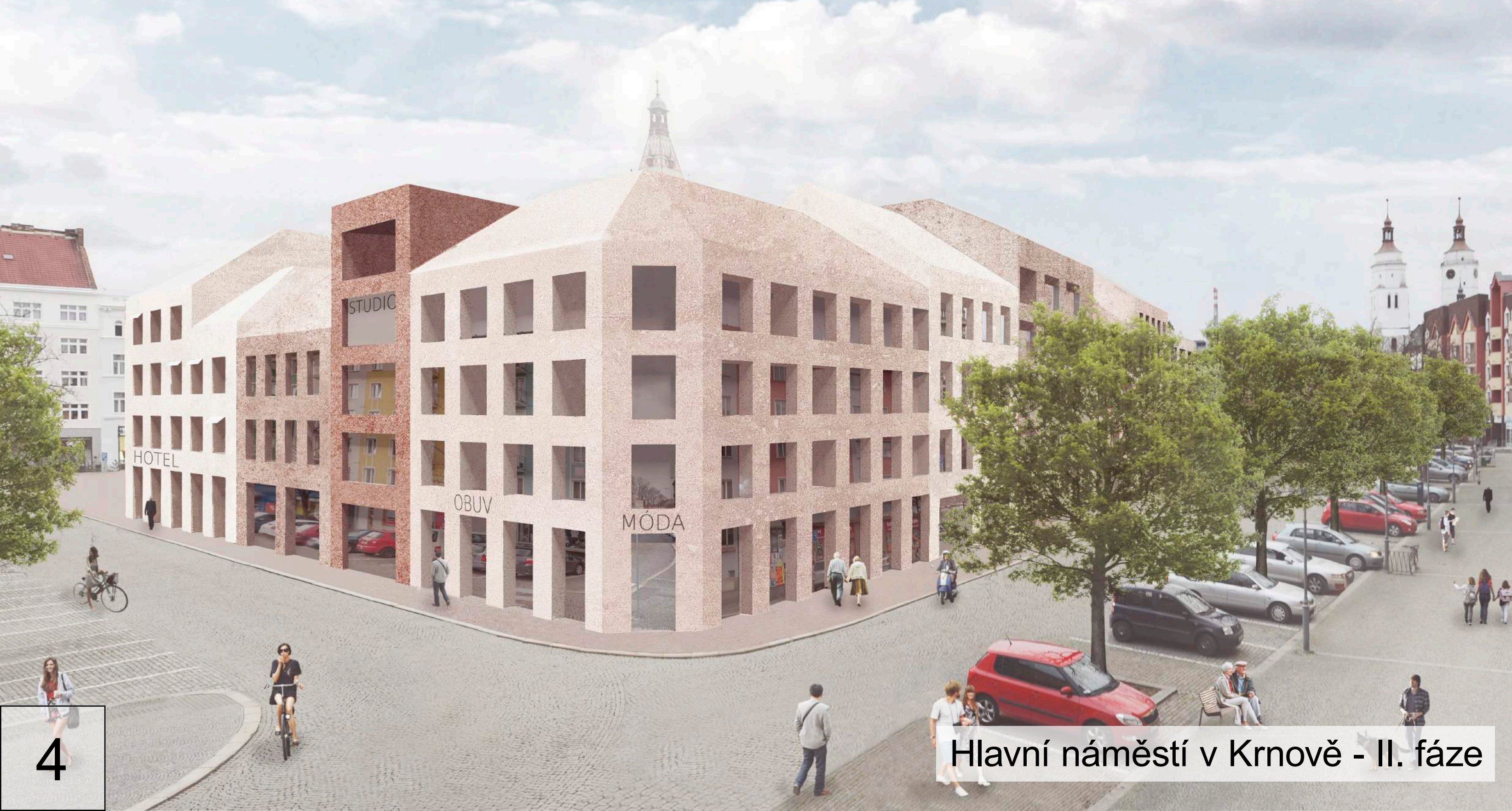
m) zázres do fotografie bez dostavby