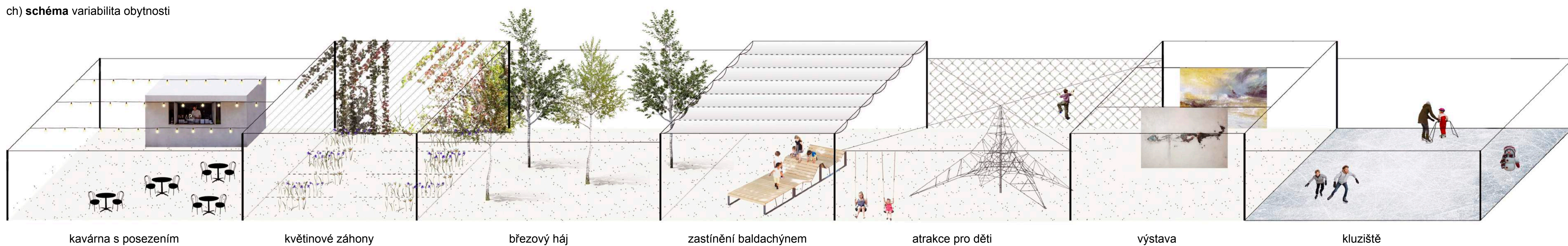
kavárna s posezením květinové záhony březový háj zastínění baldachýnem atrakce pro děti výstava kluziště