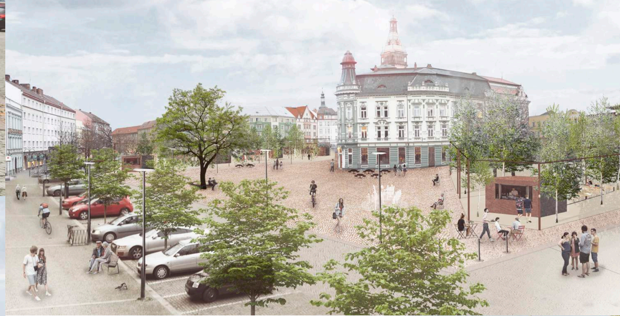
o) zázres bez dostavby