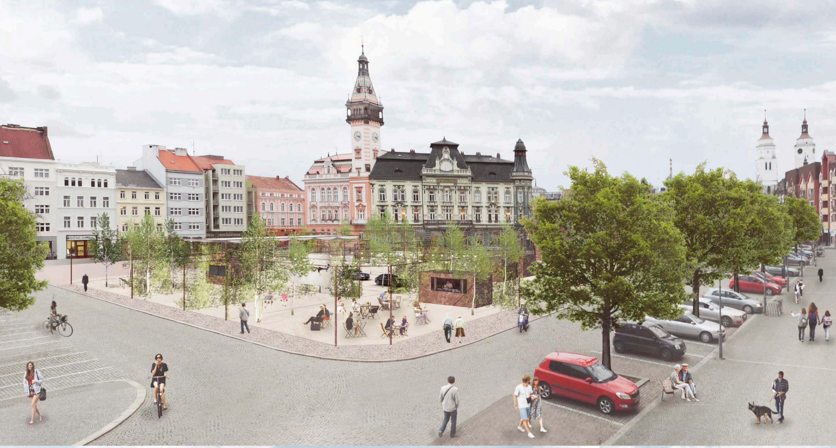
l) zázres do fotografie s dostavbou