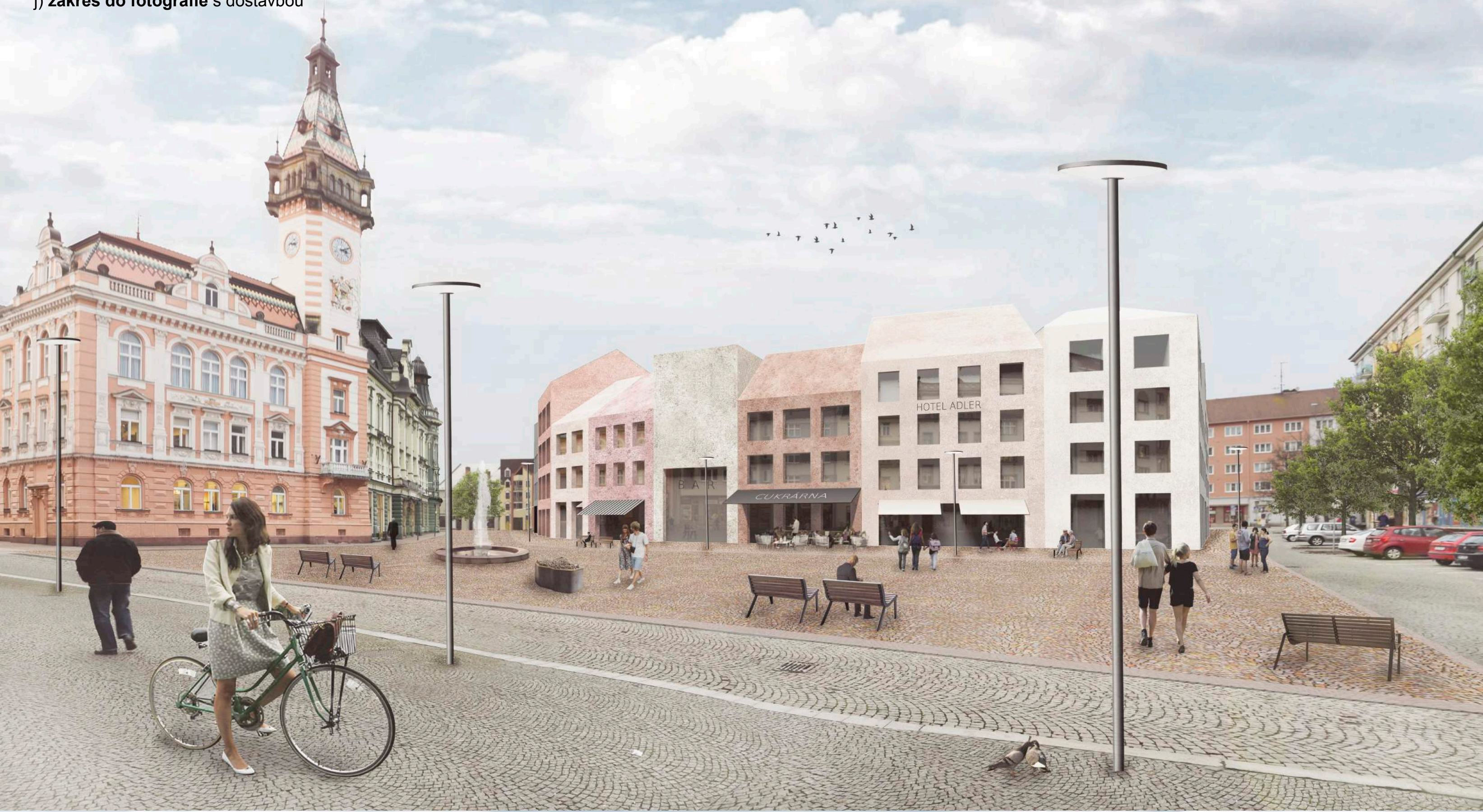
j) zázres do fotografie s dostavbou