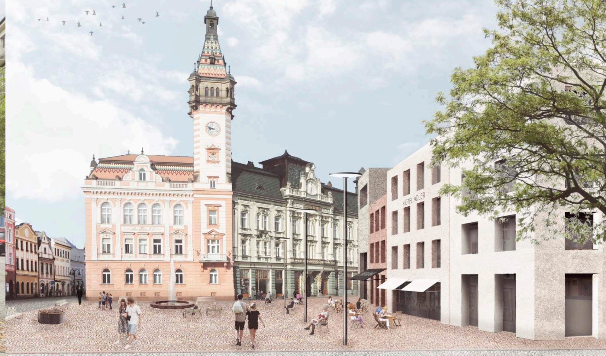
p) zázres s dostavbou