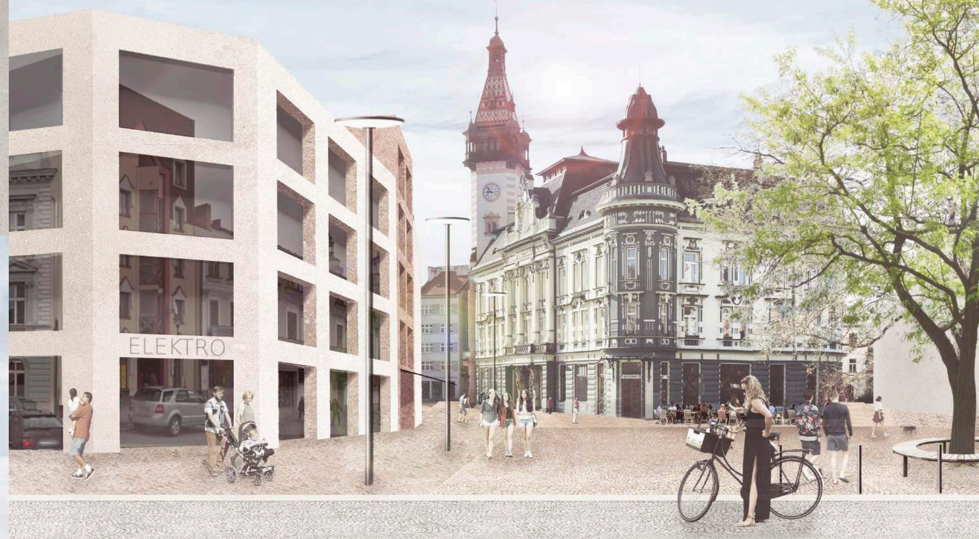
r) zázres s dostavbou