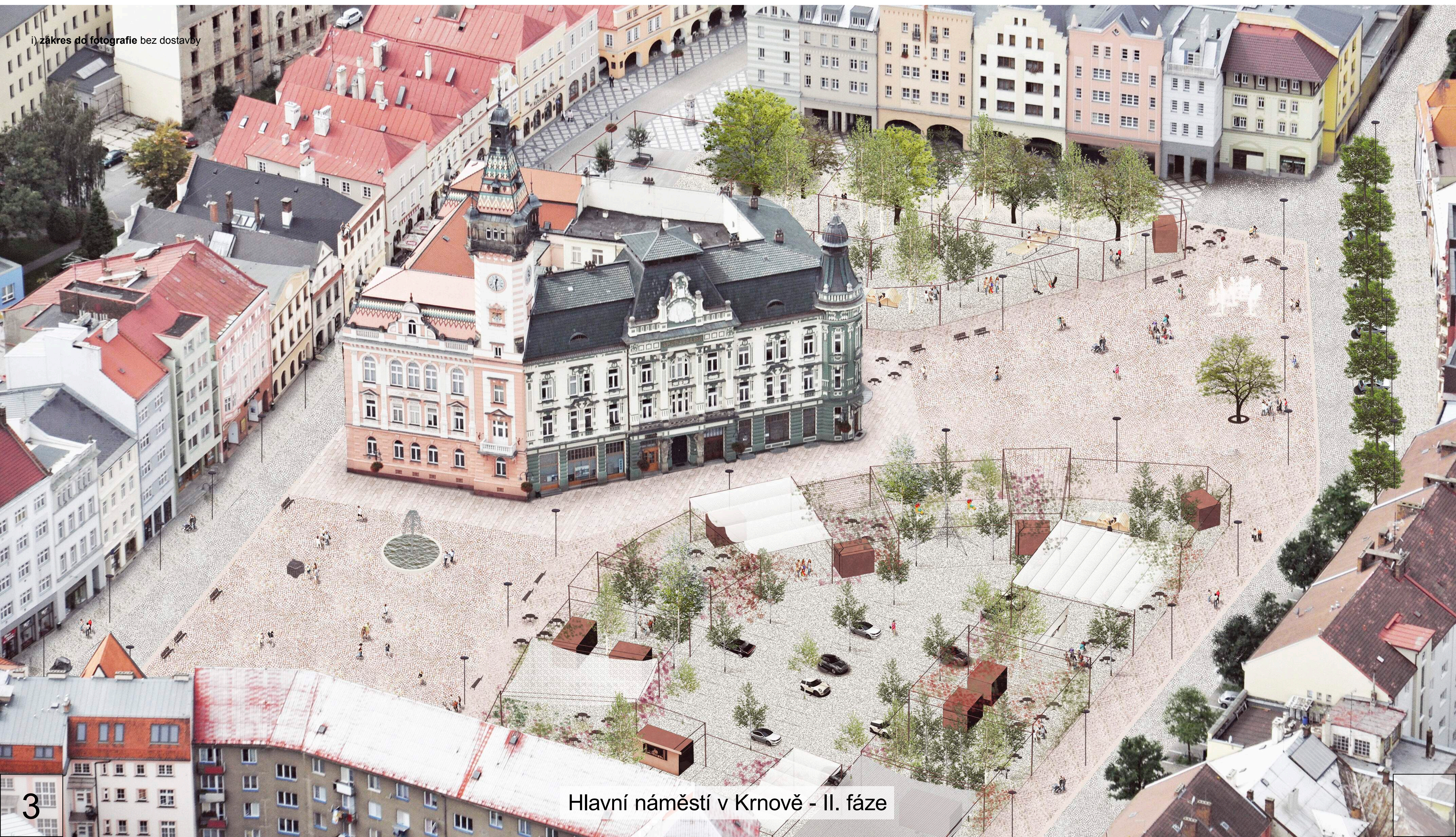
Hlavní náměstí v Krnově - II. fáze